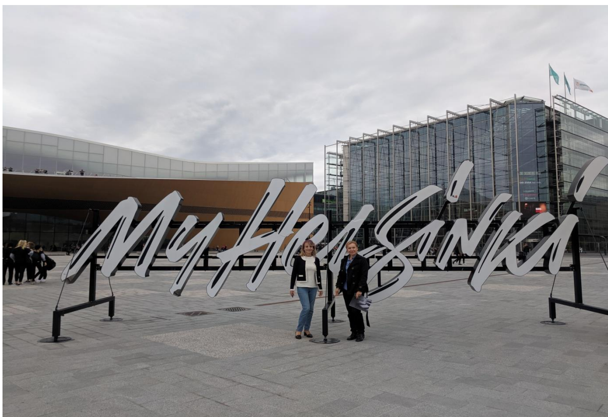
Модерната обществена библиотека в Хелзинки