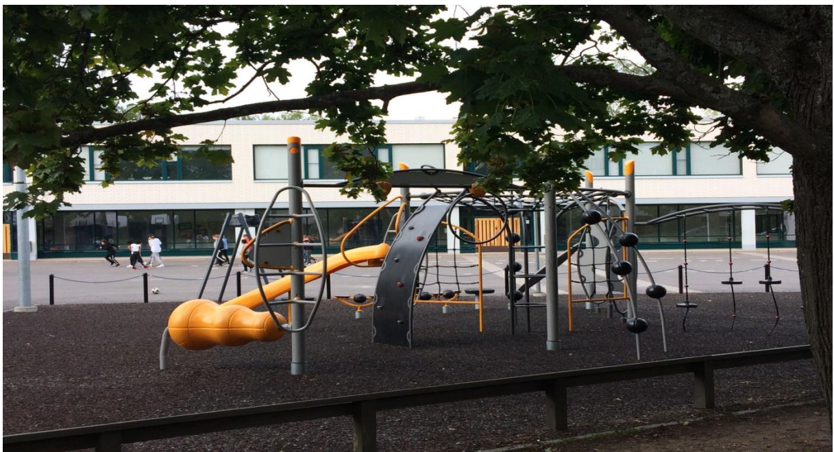
Посещение във финландско училище