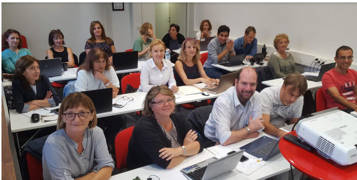
По време на курса „Обучение чрез игри и „игровизация” в моята класна стая” с колеги от пет различни националности